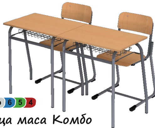
Стифираща маса Комбо