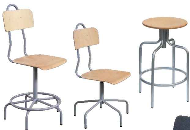
Винтови столове и табуретки