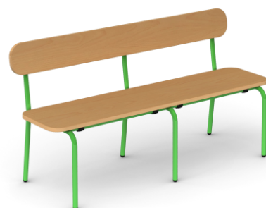
Детски столове и пейки Савулен