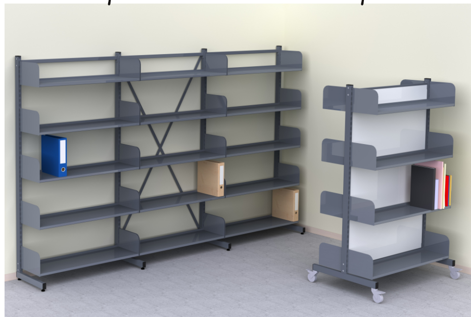
Метални регали за библиотеки и архиви