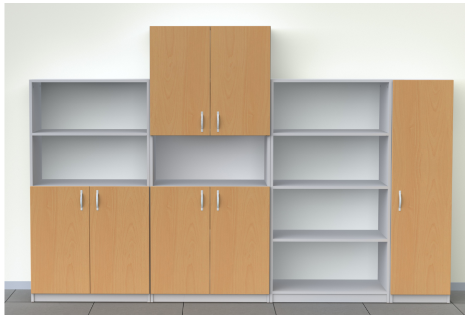
Шкафове за учителската стая